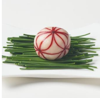
粒餡華手まり： 華やかさとモチモチ感がアップ