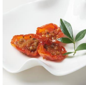
チェリートマトのハーブオイル漬： 酸味のある品種を選び旨みを凝縮