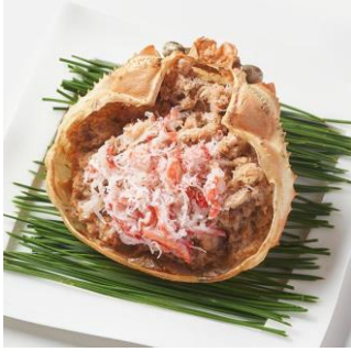
蟹甲羅盛： 蟹みそを混ぜこみ濃厚な旨み