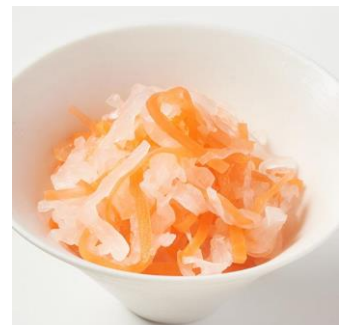
紅白なます： お酢の量を調整しより食べやすく

【商品概要】 ※価格は購入時期によって異なります。詳細は販売ページをご覧ください。