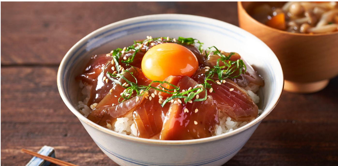
▲【豊洲目利き人厳選】国産本カツオ漬け丼

食品のサブスクリプションサービスを提供するオイシックス・ラ・大地株式会社(本社:東京都品川区、代表取締役社長:高島 宏平)が展開する「Oisix」は、2021年9月9日(木)より、本年3月に連結子会社化した株式会社豊洲漁商産直市場と共同開発した「【豊洲目利き人厳選】国産本カツオ漬け丼」を販売開始します(URL: http://www.oisix.com/sc/osakana )。