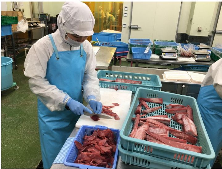
▲製造工場でハギレを手切りする様子