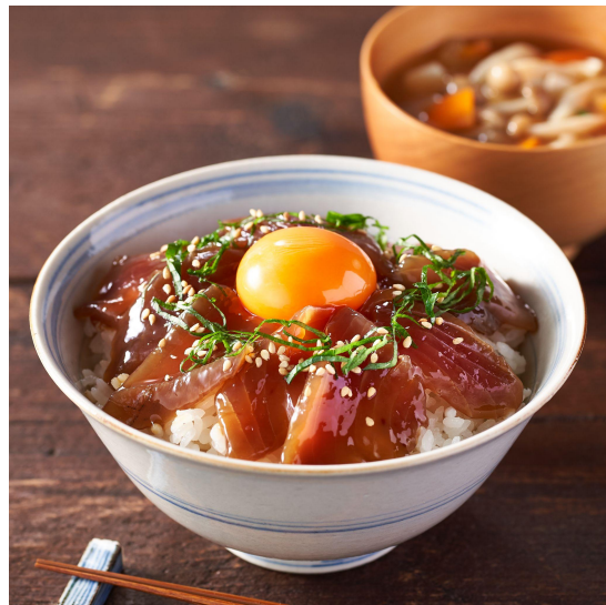
▲【豊洲目利き人厳選】国産本カツオ漬け丼