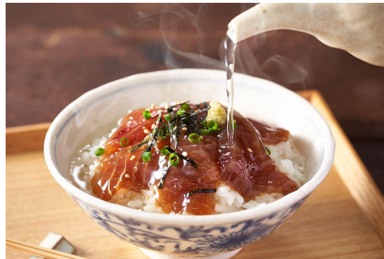
▲(アレンジ例)お茶漬け