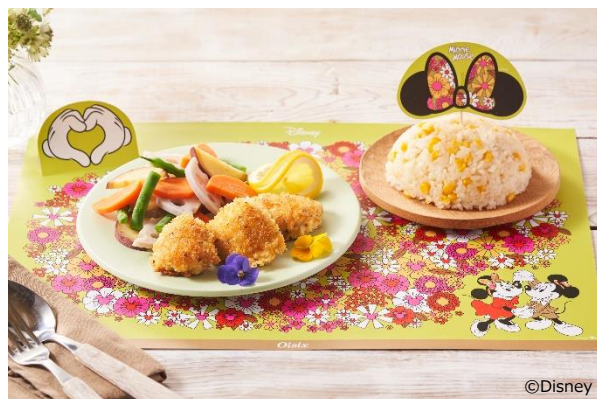
▲＜ミッキー&ミニー＞チキン香草焼き 商品写真

また、レシピカードの一部には「野菜のお花クイズ」を記載し、キッチンや食卓でのお子さまとのコミュニケーションに活用するツールとしても利用できます。