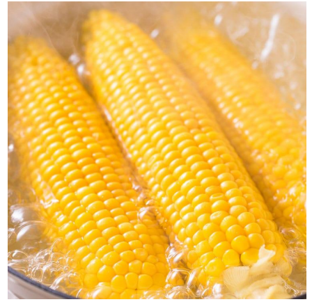
▲とうもろこし(埼玉県産)

商品詳細: 悪天候に負けず、元気に育ったとうもろこしを特別価格でご用意しました。