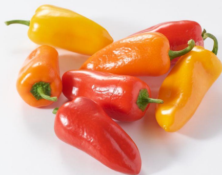
▲でこぼこミニパプリカ(栃木県産)

URL: https://www.oisix.com/sc/220707paprika