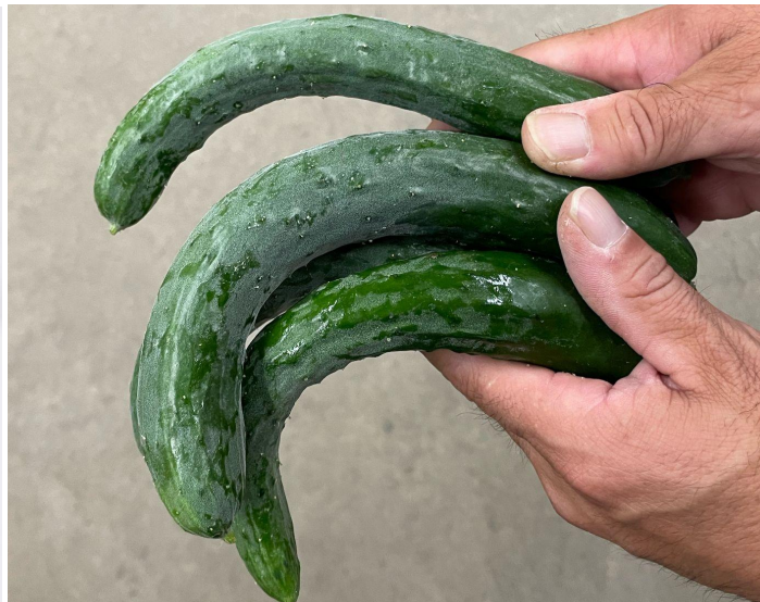
▲曲がりおしろいきゅうり(福島県産)