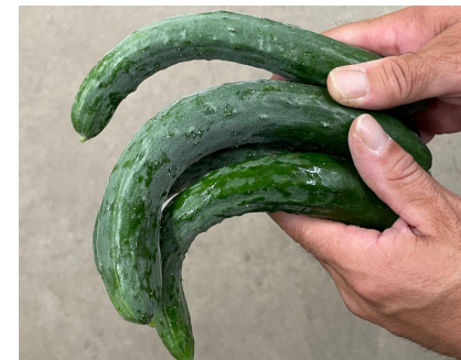
▲まがりおしろいきゅうり(福島県産)