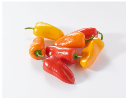
▲でこぼこミニパプリカ(栃木県産)

販売ページURL: https://www.oisix.com/sc/220707paprika