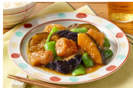
▲【超ラク】 お手軽！やわらか揚げ豚の酢豚

商品説明：彩り豊かな野菜の入った酢豚が、あっという間にできあがります。やわらかなのにゴロっと食べ応えある揚げ豚と優しい酸味です。