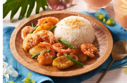
▲Kit Oisix ガーリックシュリンプグリル

商品説明：かんたんなのに本格的な和食が楽しめるメニュー。さばのみぞれ煮は湯煎で、副菜も火を使わずに仕上げます。