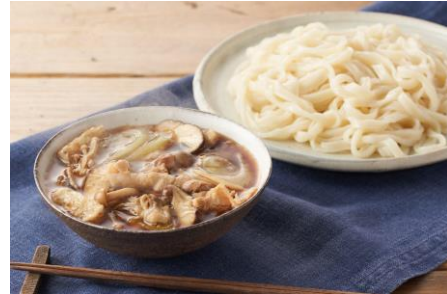
▲麺Kit 国産小麦100%の麺で！肉汁つけうどん

商品説明：食のセレクトショップ DEAN & DELUCAとのコラボメニュー。おうちでカフェ気分をお楽しみいただけるデリ風ワンプレートです。