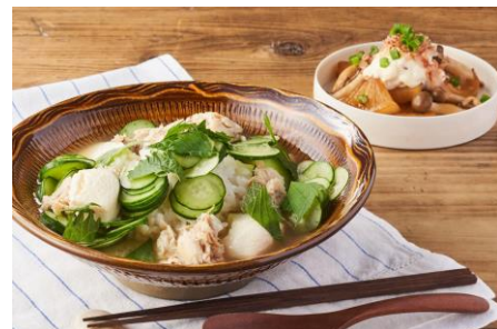
▲火いらず！さばっぱのさっぱり冷や汁

商品説明：赤魚とほたての稚貝が入った、豪華仕立てのアクアパッツァ風パスタ。煮込むことで魚介の旨みを引き出した出汁をしっかりと麺にからめるのが、おいしさのポイントです。