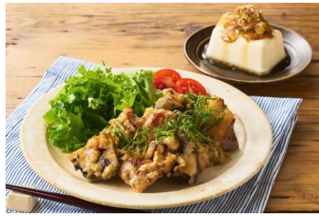
▲Kit Oisix 笠原流 鶏とうまいたけのねぎ味噌焼き

商品説明：こんがりと焼いた鶏肉、こりこりとした食感が楽しいうまいたけに、薬味の風味豊かな味噌だれをからめてごはんにぴったりの味わいです。セロリとおかかの意外な組み合わせがクセになる副菜と合わせて笠原さんならではのアイデアが詰まった献立です。