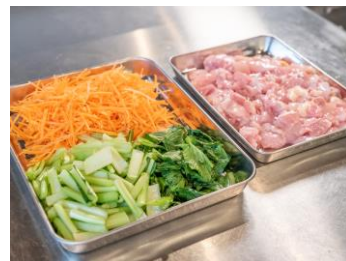
▲「給食用手作りミールキット」一例

この度のブランド刷新では、「Oisix」ブランドの認知度や信頼度を活かし、栄養士を中心に給食に関わる全ての人と一緒に作ることをイメージした積み木をモチーフに、ロゴマークを開発しました。