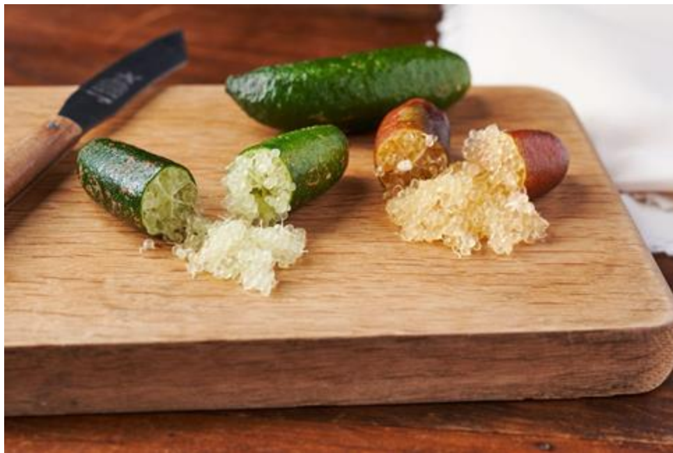
▲「まるでキャビア! プチプチ爽やかフィンガーライム（沖縄県産）」

URL: https://www.oisix.com/sc/fingerlime