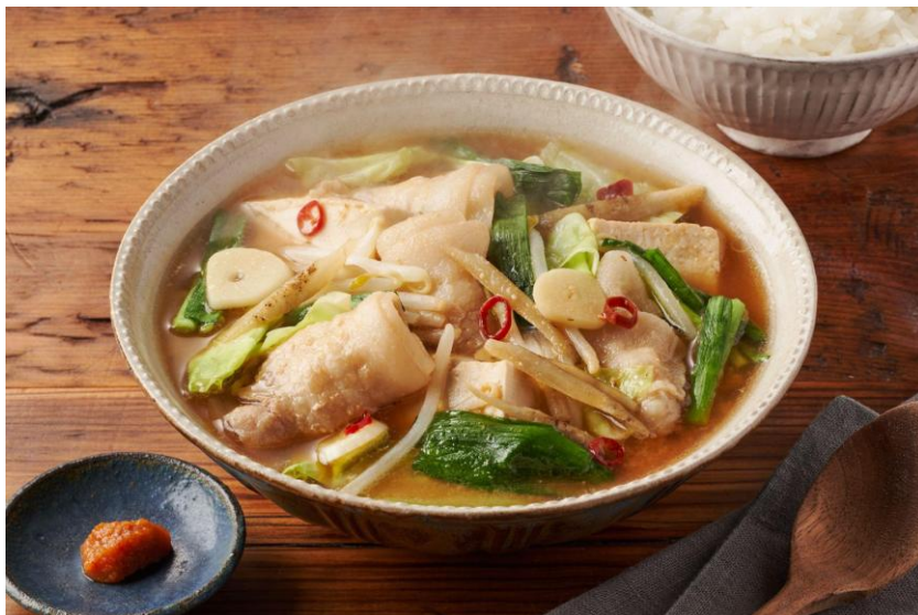
▲Kit Oisix「1/2日野菜！豚バラもつ味噌煮込み風」