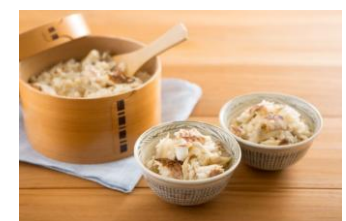
▲Kit Oisix 「丸ごと天然小鯛の鯛めし」

これは、忙しい毎日の中で時短することだけではなく、食卓において季節感を大事にしたい