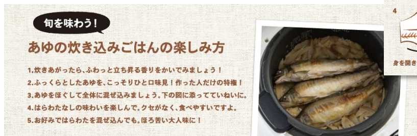
▲あゆの炊き込みごはんの楽しみ方を解説