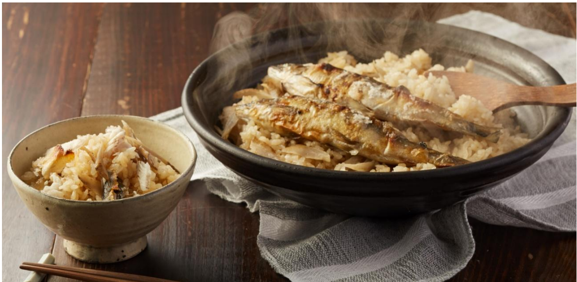
▲Kit Oisix 「今が旬！丸ごとあゆの炊き込みごはん」

Kit Oisix は、主菜・副菜を20分で作ることが出来、特に夕食作りが“時短”になるという点にご好評をいただいておりますが、今後も日常使いだけでなく、季節を感じられ、日々の食卓をより豊かに彩ることができる商品を積極的に販売してまいります。