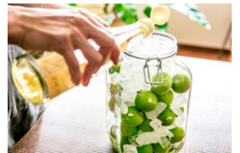
▲梅しごと Kit<梅酒、梅ジュース>

当社では本年、あえて手間のかかる Kit Oisix「手仕事シリーズ」商品について、昨年は1年間で6商品だったラインナップを今年には新商品を加え3ヶ月で6商品と大幅に強化しました。季節行事を大事にしたいけれど、時間をかけて自家製にチャレンジするには抵抗感のある方や、忙しくて材料を買い揃えたり下準備に長い時間をかけることの出来ない方のために、様々な「手仕事」に必要な使い切りの量の食材と、丁寧に工程を説明したレシピカード、必要な道具をセットにした状態でお届けする点にご支持頂き、梅酒や梅シロップを作ることができる「梅仕事キット」は昨年の1.3倍(※)の販売数となり、非常に好調です。※2018年6月14日時点