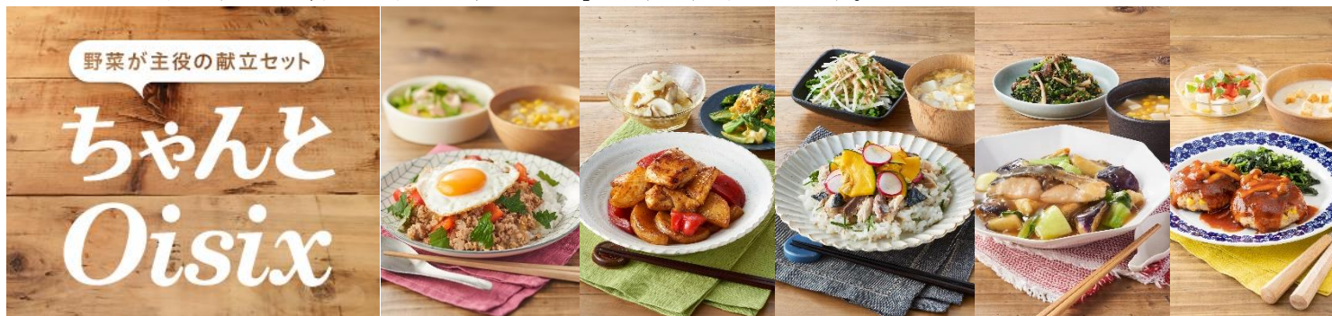
▲「ちゃんとOisix」ロゴとメニュー例

10月1日より消費税が増税となり、家計への影響が生じると考えられるこのタイミングで、新たなお客様がもつニーズに合わせてサービスを拡大するため、献立セット「ちゃんとOisix」の提供を開始いたします。