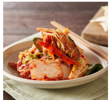
▲<Kit Oisix>野菜を加えて！ 自家製手作りキムチ（イメージ）