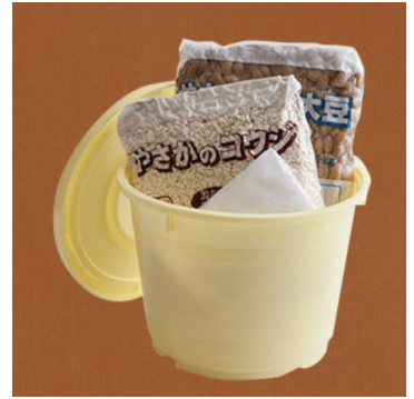
▲<Kit Oisix> 季節の手仕事を 楽しむ！手作り味噌 （味噌樽つきお届けイメージ）