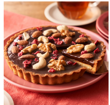
▲<Kit Oisix>3種ナッツと ベリーの濃厚生チョコタルト（イ メージ）