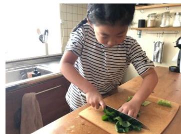
▲子どもが料理をする様子（イメージ）

また、“カフェ店員気分”を体験できるメニュー表や伝票も付属しており、作った料理を盛り付ける、配膳する、そして食べることをイベントのように一連で楽しめる仕様になっています。