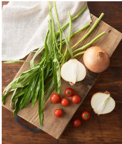
▲使用している野菜 (空心菜・ミニトマト・玉ねぎ)