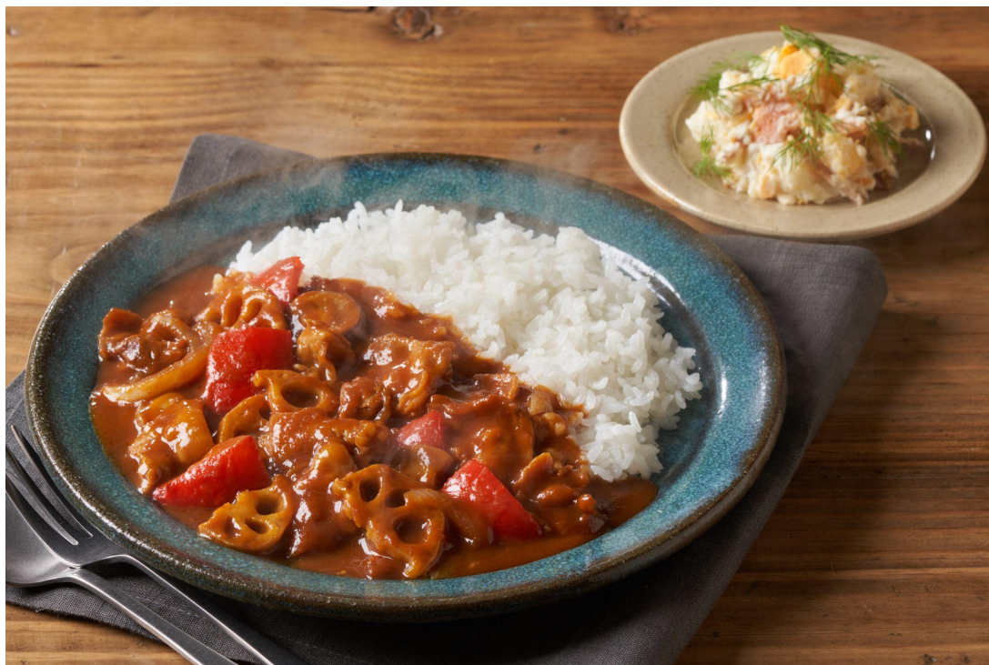
▲Kit Oisix「鳥羽シェフ監修！濃厚無限ハヤシ」（盛り付けイメージ）

（URL: https://www.oisix.com/sc/tobachef ※2021年9月30日10:00～）