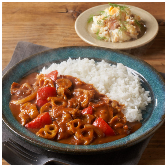
▲Kit Oisix「鳥羽シェフ監修！濃厚無限ハヤシ」 (盛り付けイメージ)

sioオーナーシェフ。1978年生まれ、埼玉県出身。Jリーグの練習生、小学校の教員を経て、32歳で料理人の世界へ。2018年、代々木上原にレストラン「sio」をオープンし、ミシュランガイド東京で2年連続星を獲得。書籍、YouTube、各種SNSなどでレシピを公開するなど、レストランの枠を超えたいろいろな手段で「おいしい」を届けています。モットーは『幸せの分母を増やす』。