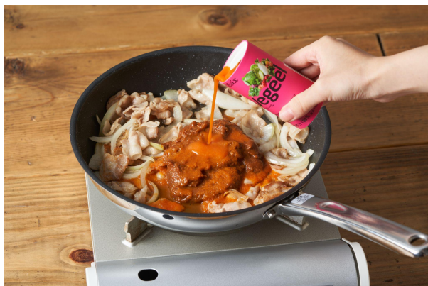
▲短時間調理で濃厚ソースが完成

このたび、鳥羽周作シェフが初めてのKit Oisixメニューとして提案するのは、「実はカレーライスよりもずっと手軽に作れる」という「ハヤシライス」。おいしさの決め手となるデミグラスソースには、18種類の野菜が入ったOisixオリジナルの野菜ジュース「Vegeel」に加え、新鮮な旬の野菜4種（玉ねぎ、マッシュルーム、パプリカ、れんこん）を使用。ご家庭でも短時間調理でレストランのように本格的な濃厚ソースが完成します。レシピの工程には、鳥羽シェフ自身がお店で実践している調理ノウハウも紹介されており、料理教室を楽しむ感覚で、お店のような仕上がりを誰でも実現することができます。