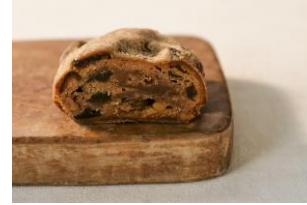
▲梅シュトレン(断面)