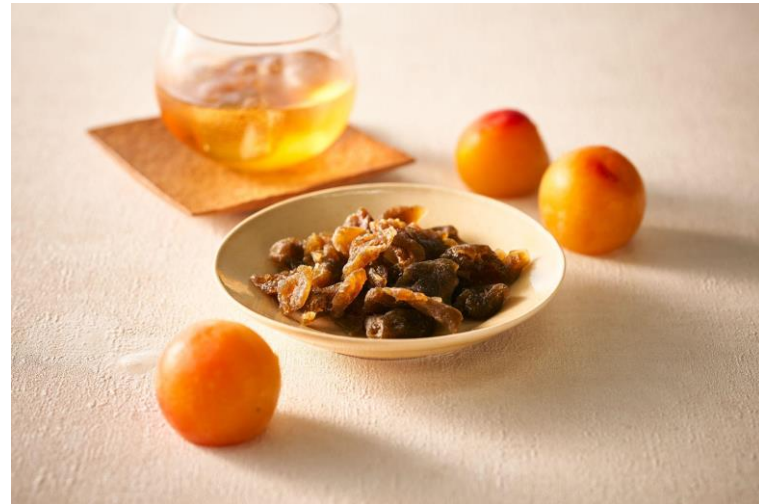
▲梅ドライフルーツ