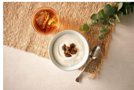
▲ヨーグルトのトッピングにもおすすめ