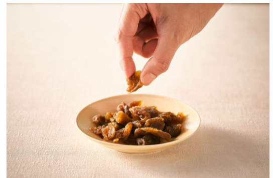
▲梅ドライフルーツ