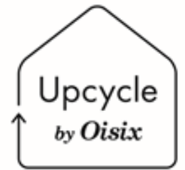
▲Upcycle by Oisix ロゴ