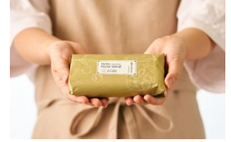
▲梅シュトレン(ラッピング)