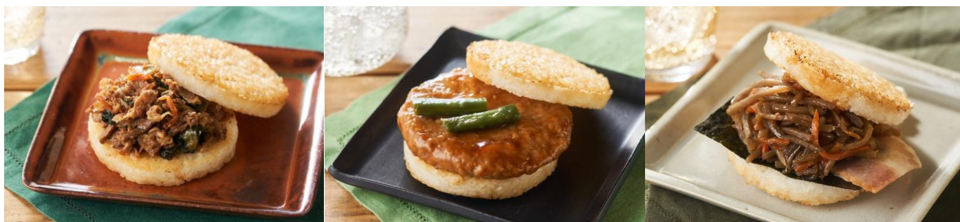
▲<左から>モスライスバーガー焼肉(Oisixバージョン)、モスライスバーガーつくね(Oisixバージョン)、モスライスバーガーきんぴら(Oisixバージョン)

※モスバーガー店舗では「モスライスバーガーつくね」「モスライスバーガーきんぴら」の販売は終了しております。