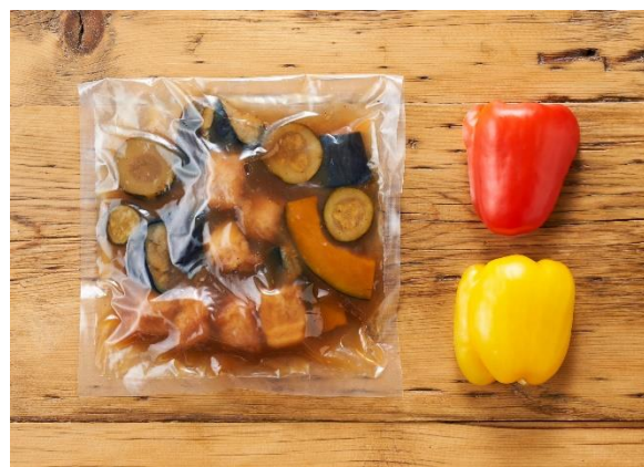
▲「超ラクKit Oisix」シリーズは肉や野菜に下味が付いた状態でお届けします。（「やわらか揚げ豚と彩り野菜の酢豚」セット内容）