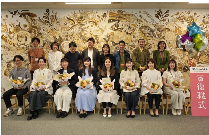
▲オイシックス・ラ・大地 2023年度「復職式」集合写真

また、「復職式」にとどまらず、当社ではアフターコロナにおけるインターナルコミュニケーションの施策として、オフラインの取り組みを充実させていきます。