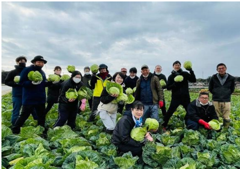
▲「畑の体感研修」の様子