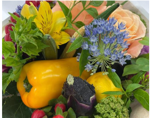
▲野菜でつくった「ベジタブルブーケ」をプレゼント