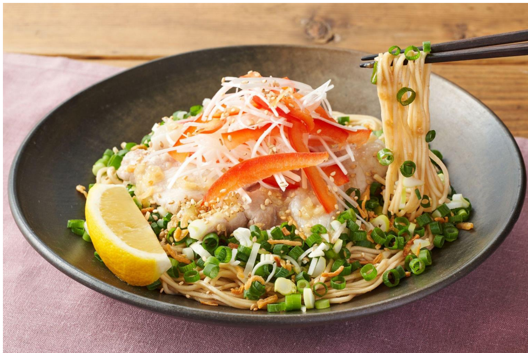
▲Kit Oisix「一風堂監修！ねぎまみれ和え麺」