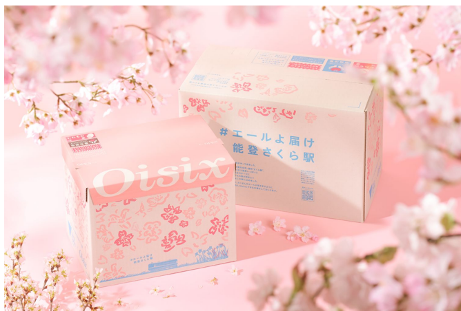
▲「奥能登の魚醤使用さつまいも炊き込みご飯の素」、期間限定でお届けしているアートダンボール