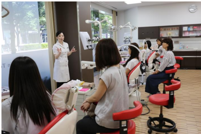
新東京歯科衛生士専門学校での様子

ミュゼホワイトニングはこれまでも、セミナーへの登壇やイベントの実施など、歯の健康やホワイトニングに関する正しい知識を与えるきっかけを作るため、様々な活動を行ってまいりました。