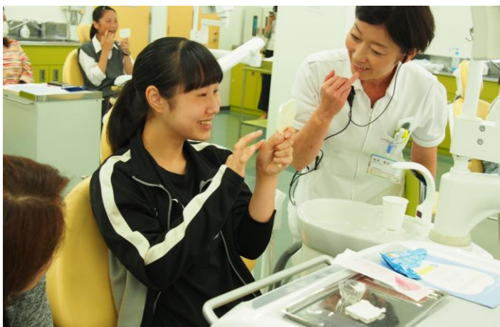
日本医歯薬専門学校での様子

全国に175店舗（※1）のサロンを展開し、店舗数・売上 No.1（※2）の美容脱毛専門サロン『ミュゼプラチナム』を運営する株式会社ミュゼプラチナム（本社：東京都渋谷区、代表取締役社長：沼田 英也）がプロデュースするデンタルクリニック「ミュゼホワイトニング」は、「日本医歯薬専門学校（杉並区高円寺）」、「新東京歯科衛生士専門学校（大田区大森）」のオープンキャンパスにて、歯科衛生士学校を目指すみなさまを応援するための特別イベントを開催いたしました。