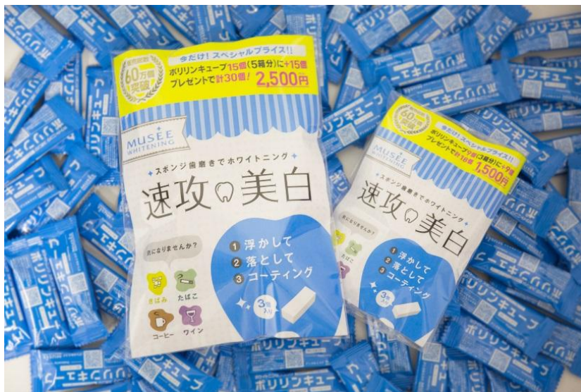
商品イメージ（左：30個セット 右：18個セット）

さらに今回、60万個突破を記念して『ポリリンキューブ』のお得な限定セットを販売することが決定いたしましたのでお知らせいたします。