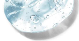
3種のヒアルロン酸

吸着型・保水型・浸透型(※5)の3種のヒアルロン酸を贅沢に配合。水分が不足しがちな肌にうるおいを届け(※5)、ツヤのあるなめらかな肌へ導きます。