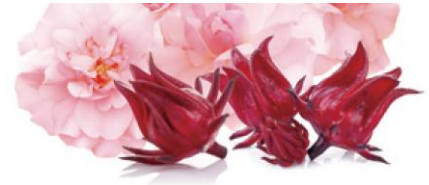
オリジナル原料 mufra (ミュフラ)

ダマスクバラ花エキスとハイビスカス発酵液による天然由来成分の相乗効果により、紫外線による乾燥を抑え、肌のうるおい持続感を高めます。