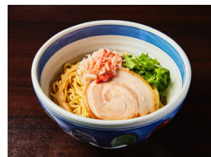
ノーマルバージョン