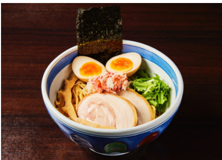
東京駅バージョン