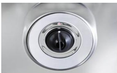
ディスポーザー (各住戸独立型)

ディスポーザー・TES温水式床暖房・Low-Eガラス・魔法びん浴槽・LED照明・節水型トイレ