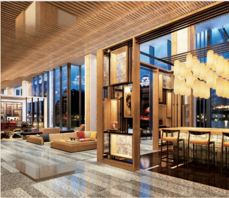
客室インフォメーション(全156室)

ホテルインディゴ犬山有楽苑には、ふたつの国宝とともに、木曾川と城下町に育まれた犬山のビビッドな歴史と文化のストーリーが、ぎっしり詰まっています。ユネスコ無形文化遺産の犬山祭の名物、からくり人形を乗せた13輛の車山 やま をモチーフにしたインテリアや、鶺鴒からインスパイアされたアートウォール。まるで宝さがしのように、ホテルのいたるところで、パワフルで刺激的な犬山カルチャーを発見できます。ネイバーフッドホストとの会話に登場する、誰かに教えたいところ踊るストーリーが、この旅をもっとエキサイティングに。