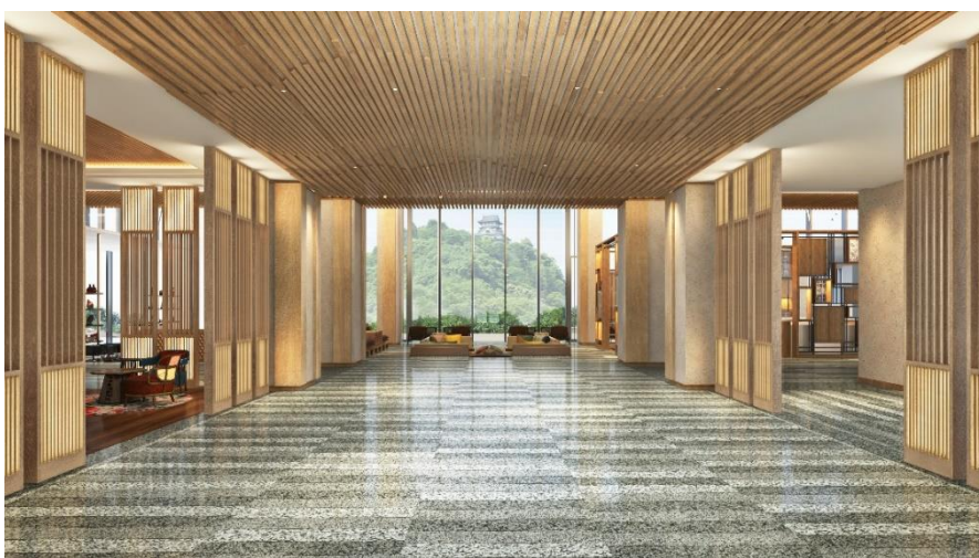
エントランスイメージ