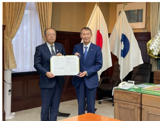
写真を貼る：上記は前回協定締結の際のイメージ