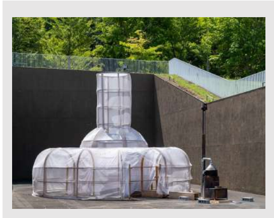
栗林隆 《元気炉》 青森県立美術館 展示の様子