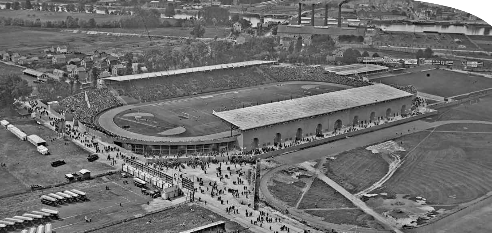
スタッド・オリンピック・ドゥ・コロンプ (Agence Rol. 1924, BnF)

主催◆独立行政法人日本スポーツ振興センター 秩父宮記念スポーツ博物館 会場◆秩父宮記念ギャラリー (国立競技場) 〒160-0013 東京都新宿区霞ヶ丘町10-1 (代: 03-5843-1300) 問い合わせ◆独立行政法人 日本スポーツ振興センター 秩父宮記念スポーツ博物館 (047-401-1724)