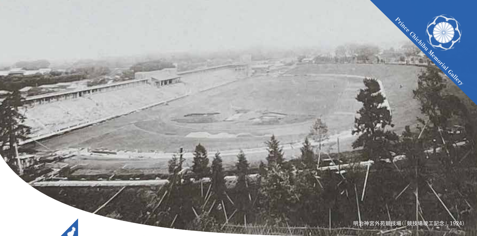
明治神宮外苑競技場(「競技場竣工記念」, 1924)