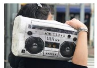
2018年に同アワードを受賞した 当社の「デザインイレットロール」

今回、当社がブランド戦略を通じて、コモディティ化していたドラッグストアのイメージを一新したことが評価され、アジアで初めて常設の商業施設が同アワードを受賞しました（インテリア/内装建築の分野）。選定理由として、次のようなコメントをいただいております：「手頃な価格の商品が幅広くそろう一方、薄利多売で差別化が難しい状況となっているドラッグストア業界の中で、情緒的価値のあるアイテムが手に入るセレクトショップのポジションに進化を遂げた」