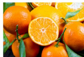
国産マンダリンオレンジエキス※3

ブースター美容液の定番である炭酸 ※4 に加え、“巡り、”をキーワードに見出した国産マンダリンオレンジエキス ※3 を配合した「モイストクリア ダブルブースターセラム」。洗顔後の肌にきめ細かい炭酸泡がすっとなじみ、みずみずしく生き生きとうるおった肌に導きます。