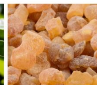
フランキンセンス※14

※12 オニサルビア油 ※13 ビターオレンジ花油 ※14 ニュウコウジュ油 (※13~14はすべて着香成分)