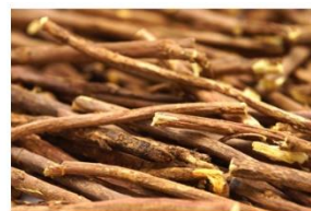
グリチルリチン酸ジカリウム※8

※7 サーファクチンNa ※8 グリチルリチン酸2K (※7は界面活性剤、※8は皮膚コンディショニング成分)