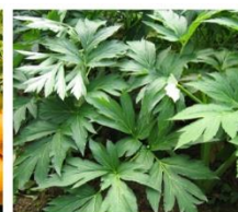
国産アシタバ葉／茎エキス※6