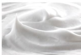
サーファクチンナトリウム※7

洗顔後の肌に心地よく使えるよう、こだわったのが泡のきめ細かさ。肌への優しさを考え、緻密な泡にすべく、発酵技術によって生まれた100%天然由来の起泡剤・サーファクチンナトリウム※7を配合。さらに、水に溶けると泡立つ性質をもつグリチルリチン酸ジカリウム※8を配合し、スキンケア効果も強化しました。