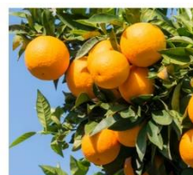
和歌山県産 ウンシュウミカン果皮エキス※6

和歌山県産ウンシュウミカン果皮エキス ※6 、国産アシタバ葉／茎エキス ※6 、ダルスエキス ※6 からなる「フィトフォースコンプレックス A ※5 」を配合。ウンシュウミカンはさらに生産者を特定し、香りや栄養成分が残った残渣（ジュースなどの搾りかす）からエキスを採取しています。