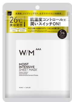
ウイズメソッドトリプルA モイストインテンシブ シートマスク 7枚入り / 770円 (税込)