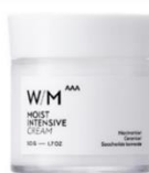
ウイズメソッドトリプルA モイストインテンシブ クリーム 50g / 1,650円 (税込)