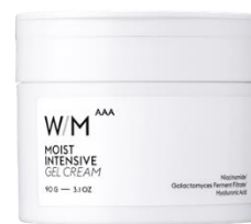
ウイズメソッドトリプルA モイストインテンシブ ジェルクリーム 90g / 1,980円 (税込)

※1 シリーズ内で ※2 保湿成分 ※3 皮フコンディショニング成分 ※4 本製品を使用することで一時的に肌表面の温度が下がること ※5 ウイキョウ種子エキス、コリアンダー葉エキス、ショウズク種子エキス、サフラン花エキス（すべて皮フコンディショニング成分） ※6 角質層まで ※7 異性化糖（保湿成分） ※8 セラミドNP、セラミドAP、セラミドNG（すべて保湿成分） ※9 乾燥によるキメ乱れによるもの *潤いスイッチ ON は潤った肌状態、潤いスイッチ OFF は乾燥した肌状態のこと