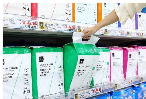
必要な情報が一目で分かり、店頭で時間をかけずに選べる

人生の分岐点は誰にでも訪れ、これまでと同じ暮らしを続けられなくなることもあります。今回の大人用おむつは、そんな分岐点のタイミングで、これまでの暮らしと変わらずに、「驚き」や「楽しさ」を楽しめる環境づくりをサポートできる商品になればと考えました。暮らしに寄り添うパッケージは、「使用時の暗く落ち込みがちな気持ちを軽減」「購入時に短時間で商品を選べる」ように工夫しています。今後も「matsukiyo」は、「介護」という日常のワンシーンをより快適になるよう、サポートしてまいります。