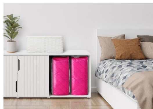
ベッドの脇においても恥ずかしさやさびしさを感じないデザイン

“これまでの暮らしを、これからも”というコンセプトのもと、機能面だけではなく、店頭で購入する時もベッドの脇に置いている時も、違和感なく暮らしに寄り添うパッケージデザインにこだわって開発しました。