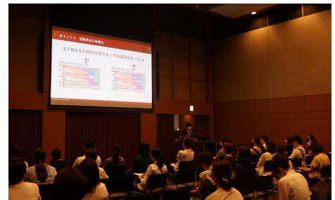
前回セミナーの様子