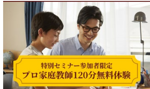
志望校合格をサポートする【受験ハンドブック】と【プロ家庭教師120分無料体験チケット】

トライでは2022年度入試で39,024名※が志望校に合格、そのうち5,354名※が難関校へ合格するなど、豊富な合格実績を誇ります。