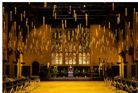
特別企画「hogwartsからの招待状」

映画『ハリー・ポッターと賢者の石』公開 25 周年を記念して、スタジオツアー東京では、特別企画「hogwartsからの招待状」を開催中。作品に登場した組分け帽の儀式や透明マント、浮遊術の授業など、印象的なシーンをデモンストレーションとともに体験いただける期間限定の特別企画です。本特別企画のフィナーレを迎える8月28日（金）から9月3日（木）の間、ツアー体験と約12分間の初公開のボーナスメイキング映像を含む本編鑑賞がセットになった特別イベント『ハリー・ポッターと賢者の石』鑑賞パッケージ』を実施いたします。映画「ハリー・ポッター」の世界を巡るツアー体験の後、スタジオツアー内のシアターのビッグスクリーンでの映画『ハリー・ポッターと賢者の石』の鑑賞は、ツアーの余韻とともに楽しむ、ここでしか味わえない特別な体験です。