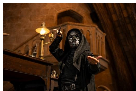
死喰い人 (デスイーター) *イメージ Warner Bros. Studio Tour Tokyo