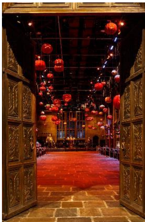
スタジオツアー-ロンドン DARK ARTS より Warner Bros. Studio Tour London – The Making of Harry Potter.

映画「ハリー・ポッター」の世界に足を踏み入れ、闇の勢力が支配する魔法界を巡る、スタジオツアーならではのスリリングなハロウィン体験にどうぞご期待ください。