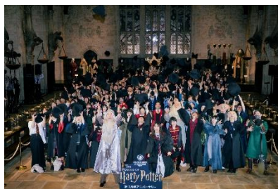
映画の名シーンをイメージしたフィナーレ