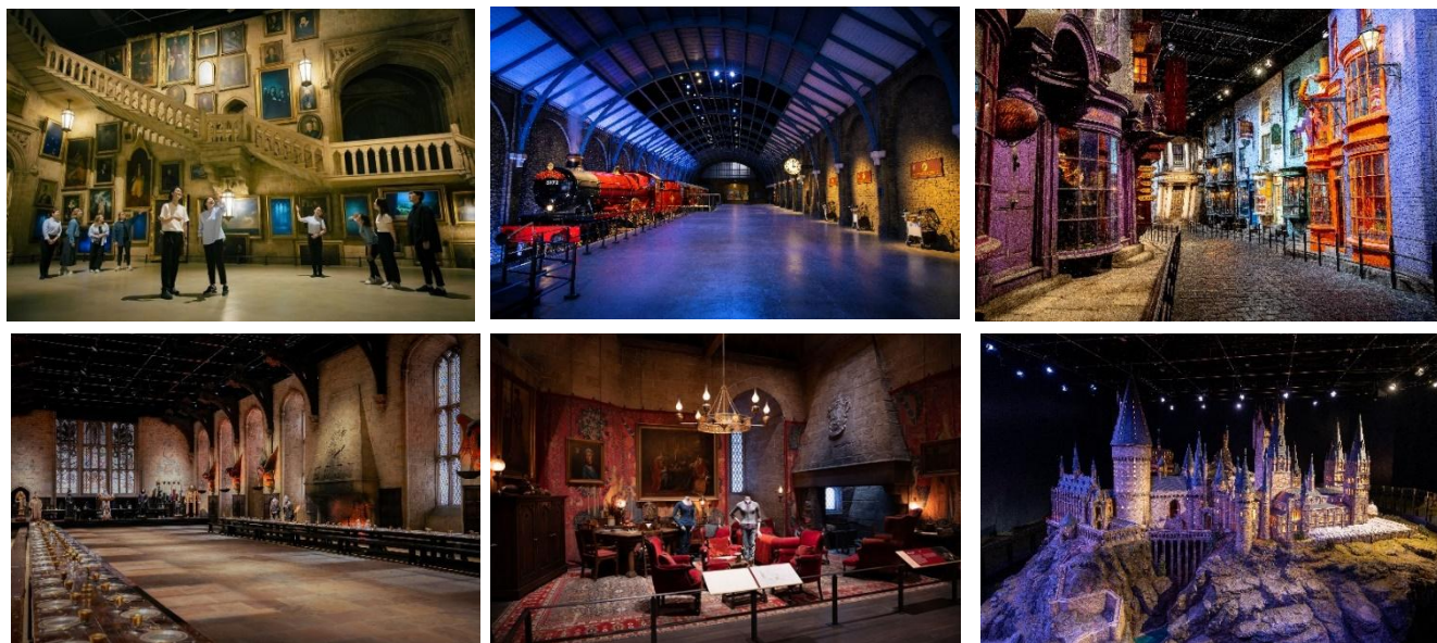
Warner Bros. Studio Tour Tokyo – The Making of Harry Potter.

ハリーのもとに届いた一通の手紙のように、この企画は魔法の世界への扉をひらき、「ハリー・ポッター」の映画の世界に足を踏み入れる一歩となる、すべての人に向けた「招待状」です。