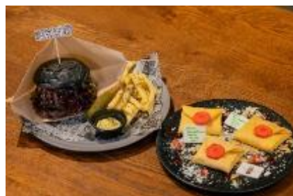
Warner Bros. Studio Tour Tokyo – The Making of Harry Potter.