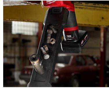
部品ナットやボルトなどを保持できる マグネットアームトレイ仕様