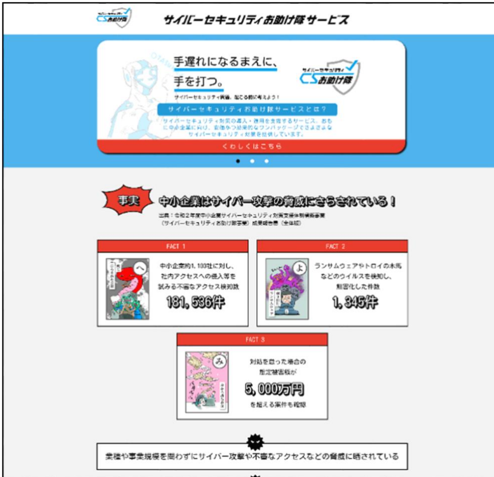
図1. 「サイバーセキュリティお助け隊サービス」ウェブサイト