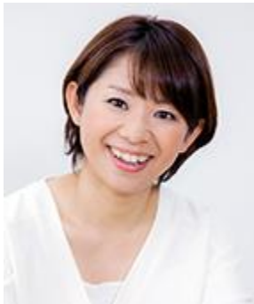
フリーアナウンサー 内田 まさみ氏