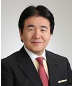
慶應義塾大学 総合政策学部教授 / グローバルセキュリティ研究所所長 竹中 平蔵氏