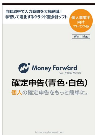
『マネーフォワード 確定申告』

商品名 : マネーフォワード For BUSINESS (法人会計) 販売価格 : 19,800 円(税込) 利用期間 : 12ヶ月 (プロダクトキー入力日から起算して 365 日) 内 容 : プロダクトキー、スタートガイド