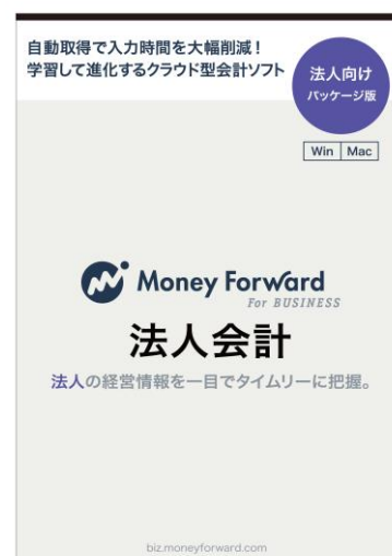
『マネーフォワード For BUSINESS (法人会計)』