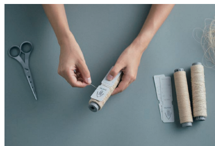
第五の天然繊維を目指して。