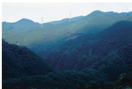
上勝町は面積の約90%が山林、殆どが杉の人工林。