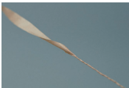
和紙を細長く切り強く撚りをかける。