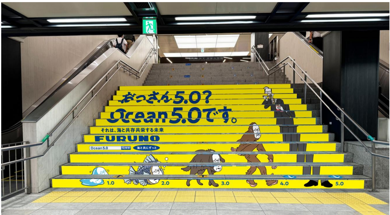
梅田アドステップ

古野電気株式会社(本社:兵庫県西宮市、代表取締役社長執行役員:古野幸男、以下 当社)は、兵庫と大阪を結ぶ阪神電車の各種交通広告媒体を活用し、企業広告「FURUNO を知ってほしくてシリーズ」を掲出します。本日 1 月 26 日(月)から順次掲出を開始し、当社の本社最寄り駅である阪神西宮駅をはじめ、大阪梅田～山陽姫路間の駅構内や駅前地下通路、車両内など広範囲にわたり企業広告を展開します。