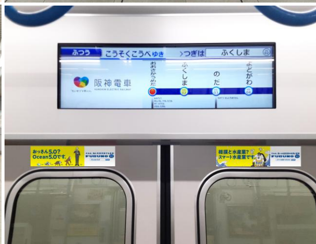
左上)梅田 8MAN 右上)梅田バーストップ 左下)西宮駅改札口ポスター(西宮駅えびす口改札横) 右下)扉上ペアステッカー(全車両内)