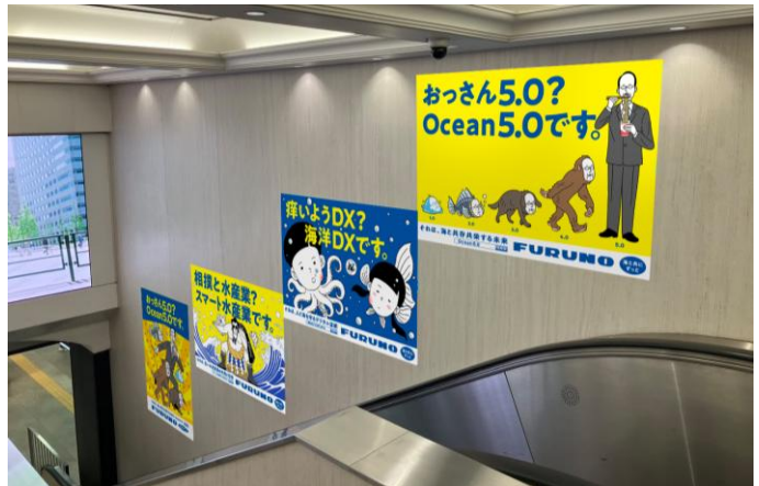
梅田大階段エスカレーター横壁面