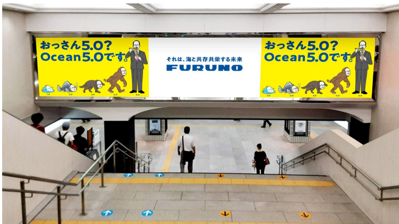
梅田メガ 10 ビジョン