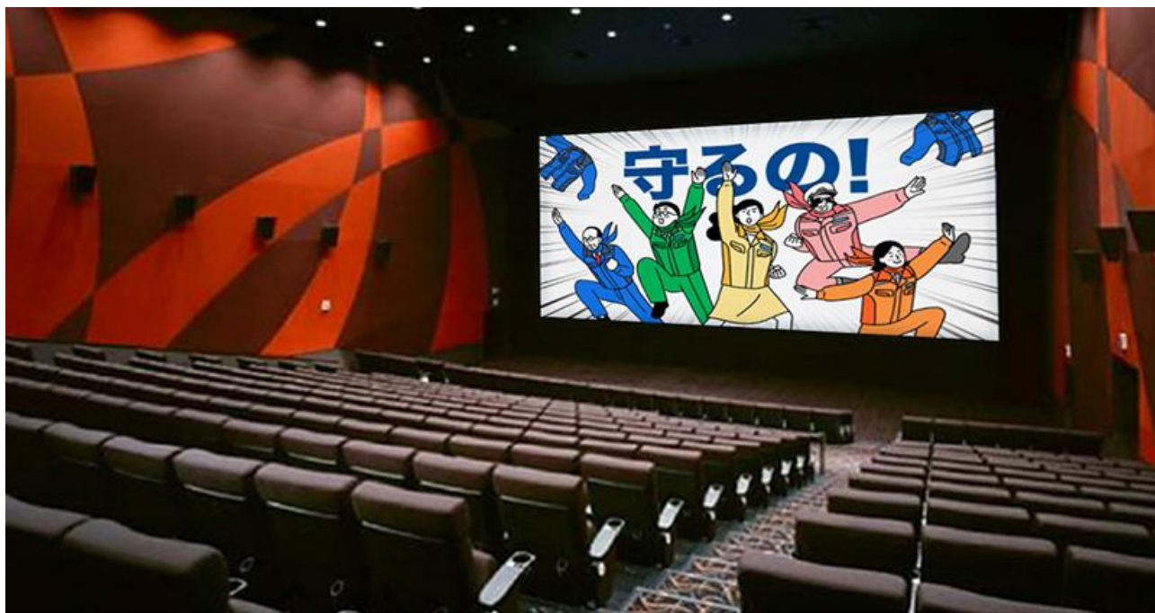
TOHO シネマズ西宮 OS

企業広告の取り組みについて、FURUNO 公式 note「海の音」でも紹介していますのでご覧ください。 海を愛し、地域に愛される、そんな企業を目指して