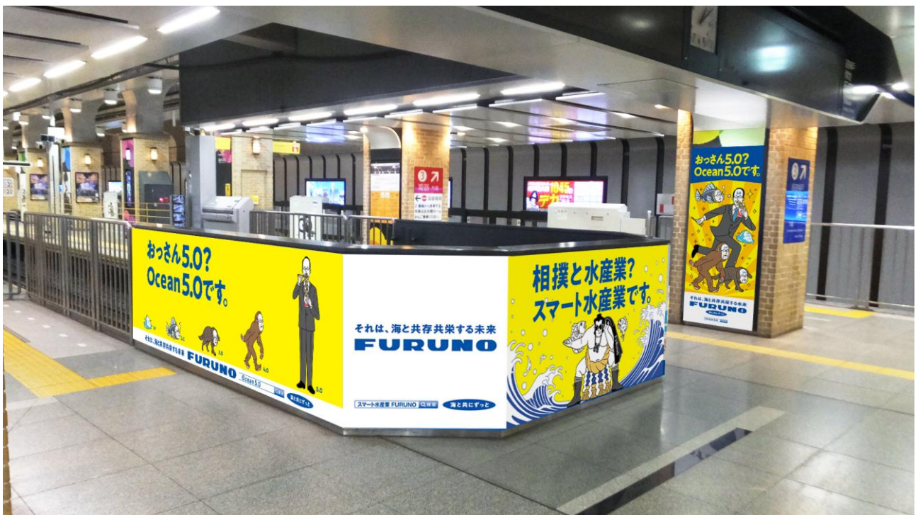
神戸三宮バーストップ