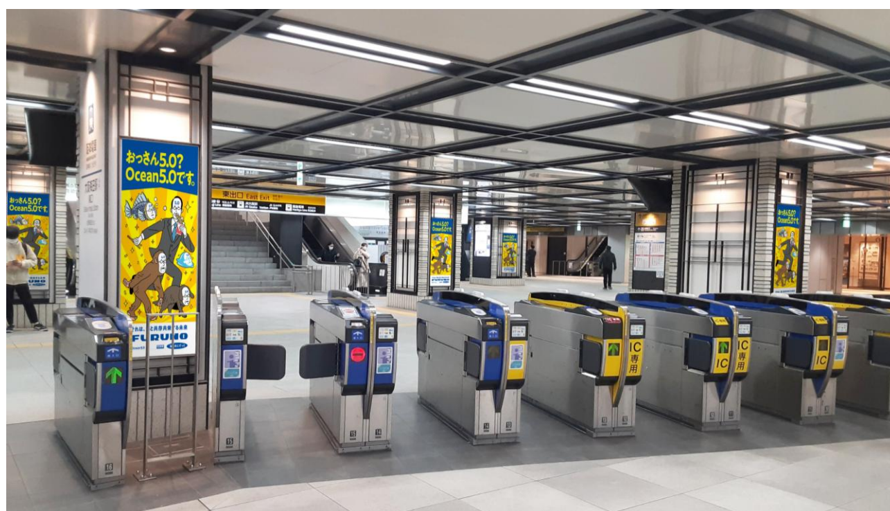
梅田駅東改札外シート(11面)