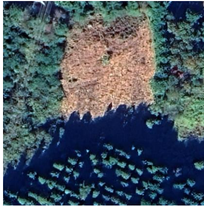
Maps Data: © Google, © Airbus (older-11/19/2024)