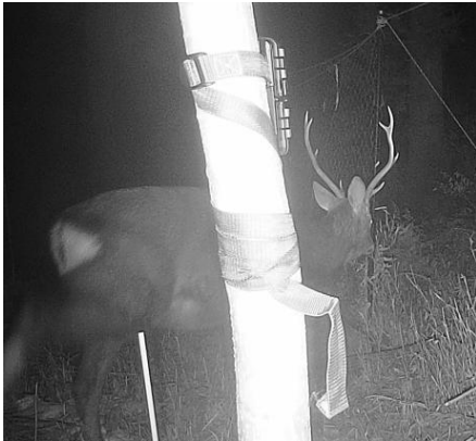
検出された動体(鹿)の撮影画像 (赤外線センサカメラで撮影)