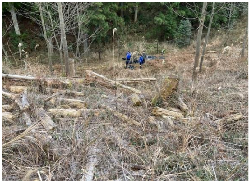
実験エリアの様子