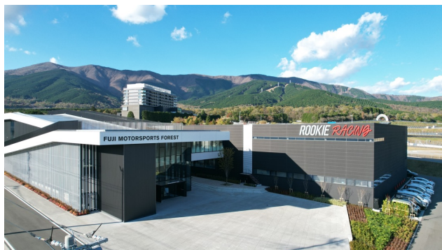
▲「富士モータースポーツフォレスト」全景

「富士モータースポーツフォレスト」は、国際サーキット「富士スピードウェイ」を中心に、ラグジュアリーエクスペリエンスを提供する「富士スピードウェイホテル」、時代を象徴するレーシングカーを展示する「富士モータースポーツミュージアム」、モータースポーツのいまを伝える「ウェルカムセンター」、魅せるガレージをコンセプトとした「ルーキーレーシングガレージ」「シェイドレーシング FUJI ファクトリー」など、モータースポーツ文化を楽しめる多彩な施設から構成されます。また、より多くの方に立ち寄っていただける温浴施設、レストランなども構想中です。