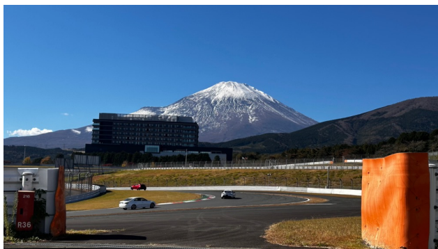
▲「富士スピードウェイ」