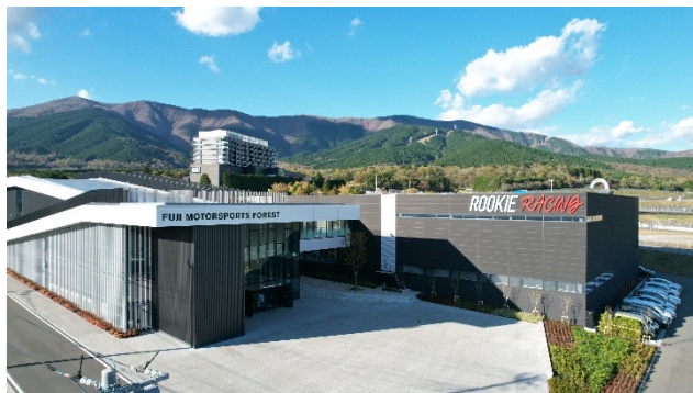
▲「富士モータースポーツフォレスト」全景

「富士モータースポーツフォレスト」は、国際サーキット「富士スピードウェイ」を中心に、ラグジュアリーエクスペリエンスを提供する「富士スピードウェイホテル」、時代を象徴するレーシングカーを展示する「富士モータースポーツミュージアム」、モータースポーツのいまを伝える「ウェルカムセンター」、魅せるガレージをコンセプトとした「ルーキーレーシングガレージ」「シェイドレーシング FUJI ファクトリー」など、モータースポーツ文化を楽しめる多彩な施設から構成されます。また、より多くの方に立ち寄っていただける温浴施設、レストランなども構想中です。