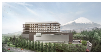
▲10月7日に開業が決まった富士スピードウェイホテル 外観