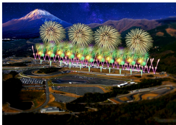
▲花火の打ち上げイメージ