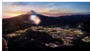
▲「富士モータースポーツフォレスト」イメージ

「富士モータースポーツフォレスト」は、トヨタ自動車株式会社、トヨタ不動産株式会社、富士スピードウェイ株式会社の3社が静岡県小山町において推進する新しいプロジェクトです。国際サーキット「富士スピードウェイ」を中心に、ラグジュアリーエクスペリエンスを提供する「富士スピードウェイホテル」、時代を象徴するレーシングカーを展示する「富士モータースポーツミュージアム」、国内有数のレーシングチームのガレージなど、モータースポーツ文化を楽しめる多彩な施設から構成されます。また、より多くの方に立ち寄っていただける温浴施設、レストランなども構想中です。